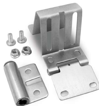
TOORS GUARDY - FSP Hoesch T09-040-40-0044

Si vous avez des questions par rapport à ce produit, merci de contacter l'entreprise TOORS.