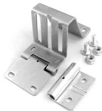
TOORS INDY - Hoesch T09-040-40-0045